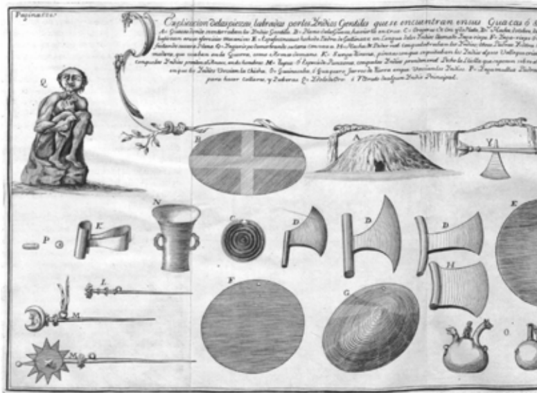
Làmina extreta de JUAN, J. A. ULLOA, 1748

Observació dels diferents contactes del trànsit de Venus realitzada per James Cook i publicada a Philosophical Transactions . S'hi observa l'anomenat efecte de gota negra, que fa molt difícil determinar el temps exacte del contacte i que ara sabem que és, principalment, degut a una manca de qualitat de les òptiques utilitzades.