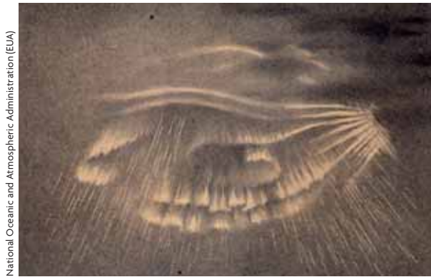
National Oceanic and Atmospheric Administration (EUA)