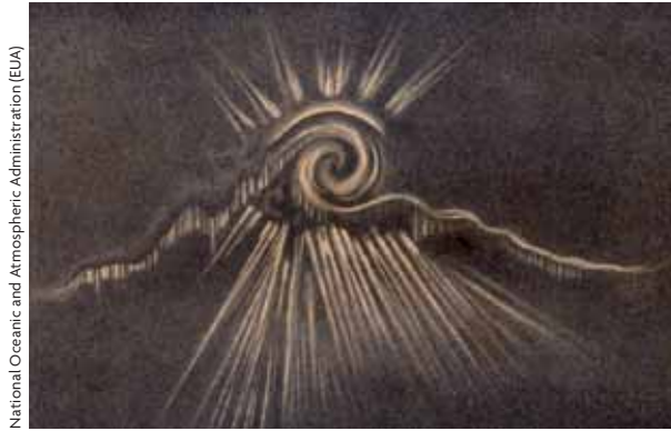
National Oceanic and Atmospheric Administration (EUA)