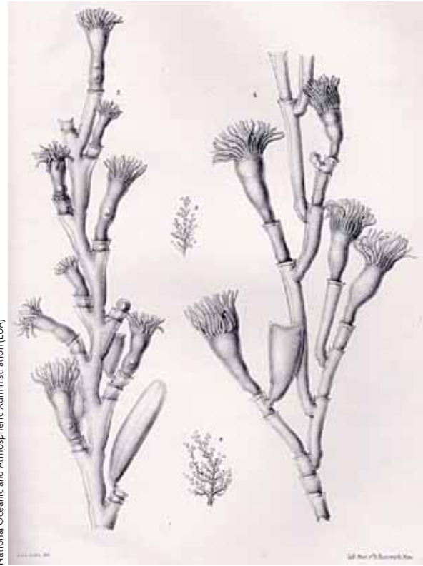
National Oceanic and Atmospheric Administration (EUA)