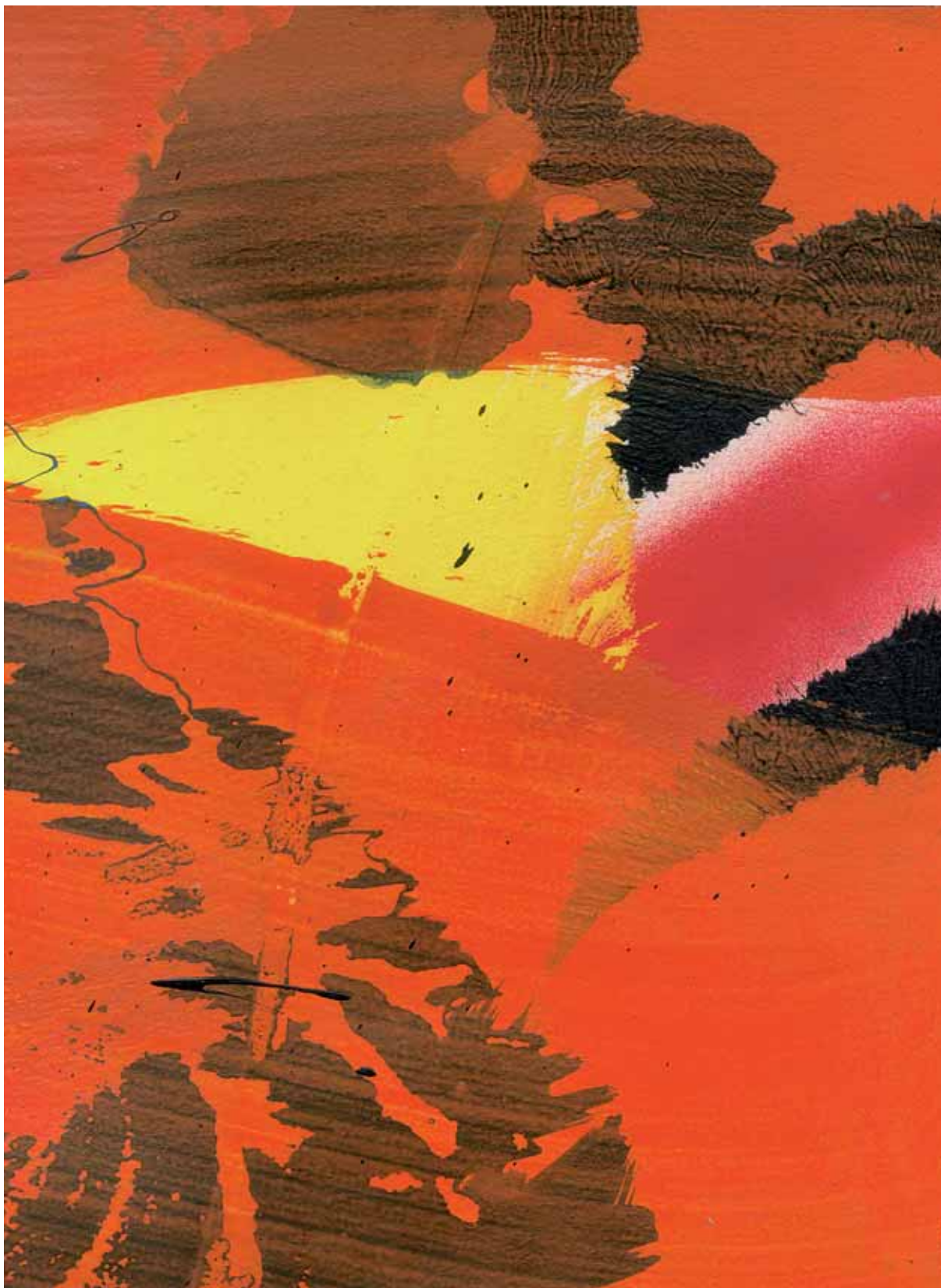
Juan Olivares. Viaatge al centre de la Terra VI , 2013. Acrílic sobre paper, 21,5 x 28,5 cm.