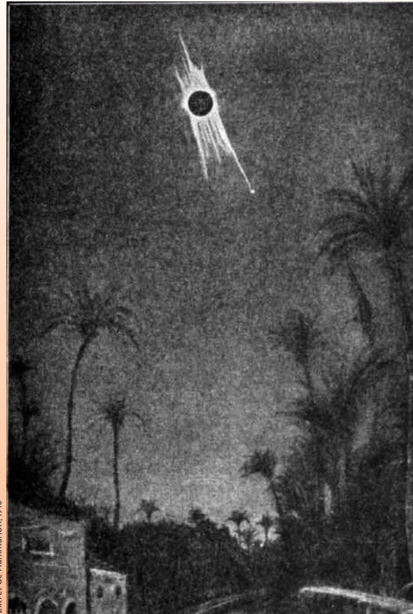
Extret de Flammarion, 1910

Però dos elements nous van reforçar l'interès dels eclipsis en aquells anys. El primer va ser la fotografia. L'any 1842 s'havia obtingut el primer daguerreotip d'un eclipsi. A partir d'aquell moment ja es podien «congelar» aquells segons fantàstics per a estudis posteriors. El segon va ser l'espectroscòpia. Ja l'any 1840 es van